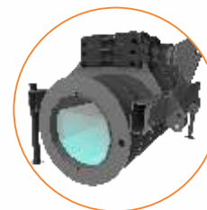
Reservatório de água