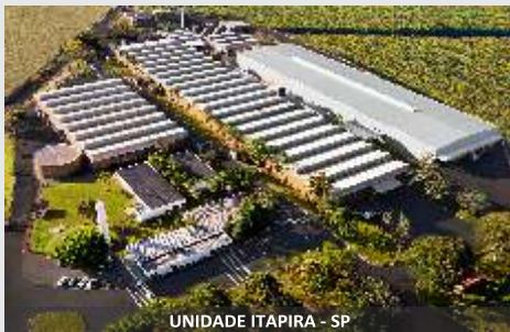
UNIDADE ITAPIRA - SP

Compactação de Silagem com qualidade. Inovação com produtividade, flexibilidade e excelente custo/benefício.