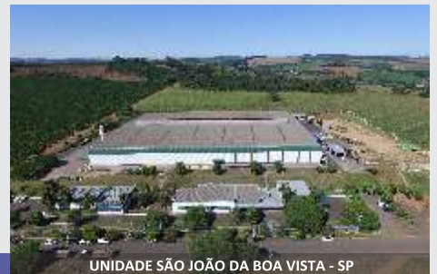
UNIDADE SÃO JOÃO DA BOA VISTA - SP

Linha de Compactação e Armazenagem JF, a solução para o produtor!