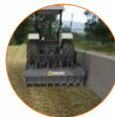
Trabalho em bordas