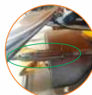
Regulagem de saída

Descritivo técnico: Distribuidor e semeadeira pendular com capacidade para 600 litros, tratorizado, estrutura em aço, reservatório em polietileno, equipado com unidade pendular independente, pêndulo em fibra de nylon, alcance de lançamento de 9 a 14 metros, sistema agitador com movimento oscilantes, agitador com cone em fibra de nylon, agitador extra para diferentes produtos, controle de dosagem através de regulagem do registro de saída, acionamento por cardan, barra dosadora, alavanca da barra dosadora, potencia requerida na TDP de 50 cv e rotação requerida na TDP de 540 RPM.