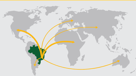
DO BRASIL PARA MAIS DE 50 PAÍSES