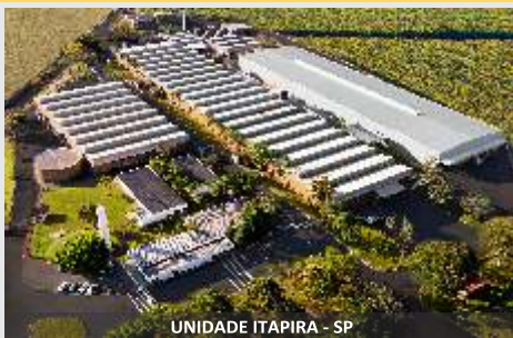
UNIDADE ITAPIRA - SP

Distribuidores de fertilizantes, sementes e calcário. Cobrando sua terra com produtividade!