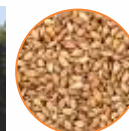
Semente de brachiária