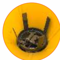
Agitador de 4 pontas com movimento oscilante