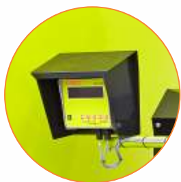
Dispositivo de pesagem programável