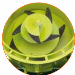
Rosca com facas para corte e mistura vertical