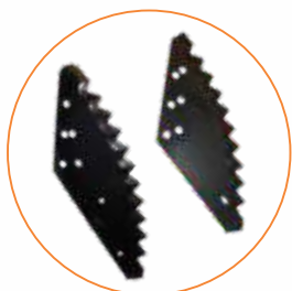
Facas especiais padrão