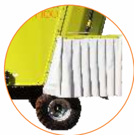
Porta de descarga direita standard