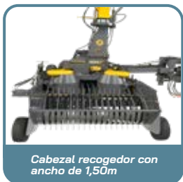
Cabezal recogedor con ancho de 1,50m

¡Tenga con JF un control absoluto del momento y la forma en que se cosecha su forraje!