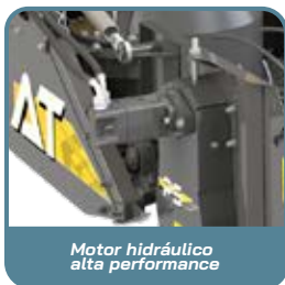
Motor hidráulico alta performance