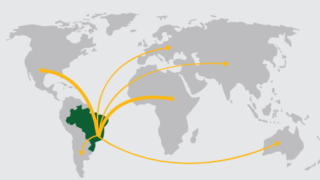
DESDE BRASIL PARA MÁS DE 50 PAÍSES EN TODOS LOS CONTINENTES