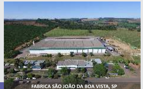
FABRICA SÃO JOÃO DA BOA VISTA, SP

Línea de Mixers JF, la solución para el ganadero!