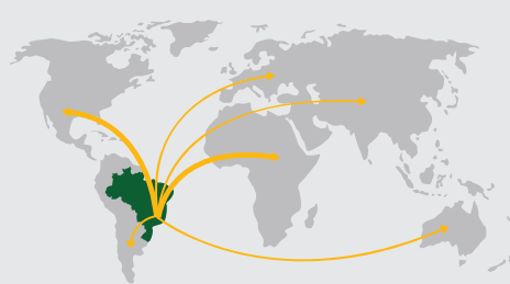
DESDE BRASIL PARA MÁS DE 50 PAÍSES EN TODOS LOS CONTINENTES