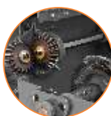
Transmissão por engrenagens e eixo