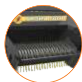
Pick-Up de 1,73m (Prisma 5000)

1 Os valores de produção citadas nas tabelas deste folheto são médias obtidas em condições de teste, podendo variar de acordo com o grau de umidade do produto, peso específico e condições de trabalho.