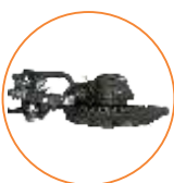
Nosador alemão Rasspe