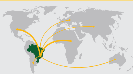
DO BRASIL PARA MAIS DE 50 PAÍSES